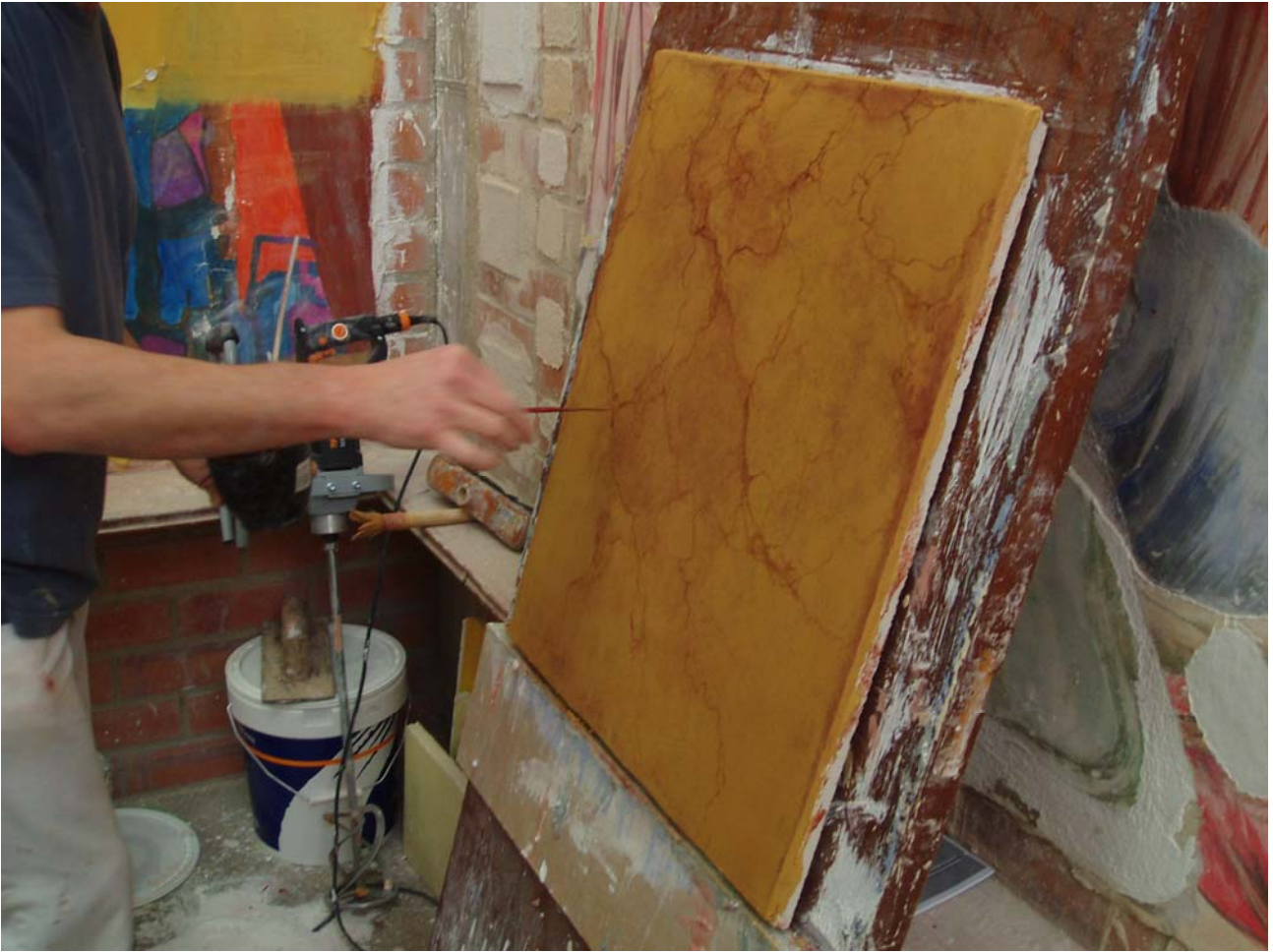
Fig. 3. Maestro estucador elaborando un estuco tipo "destonificado"