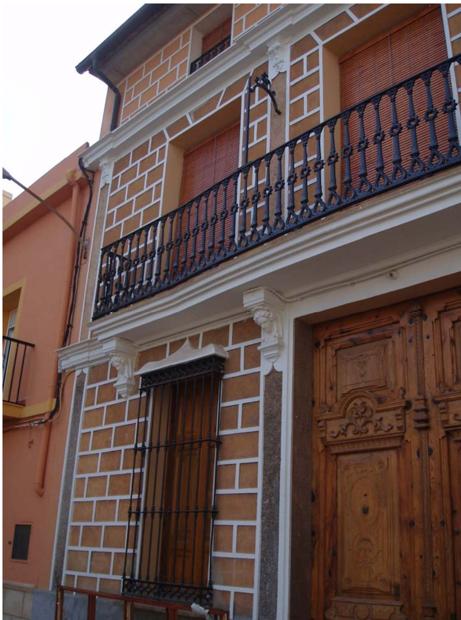
Fig. 1. Ejemplo de estuco en una típica fachada modernista valenciana.