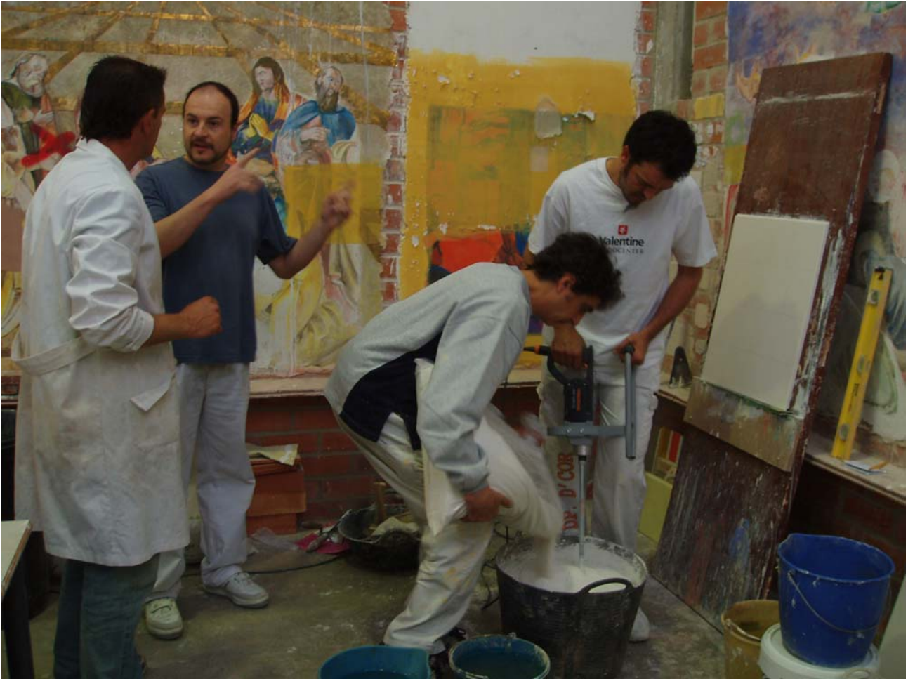
Fig 4. Grupo de alumnos colaborando en la preparación de los materiales